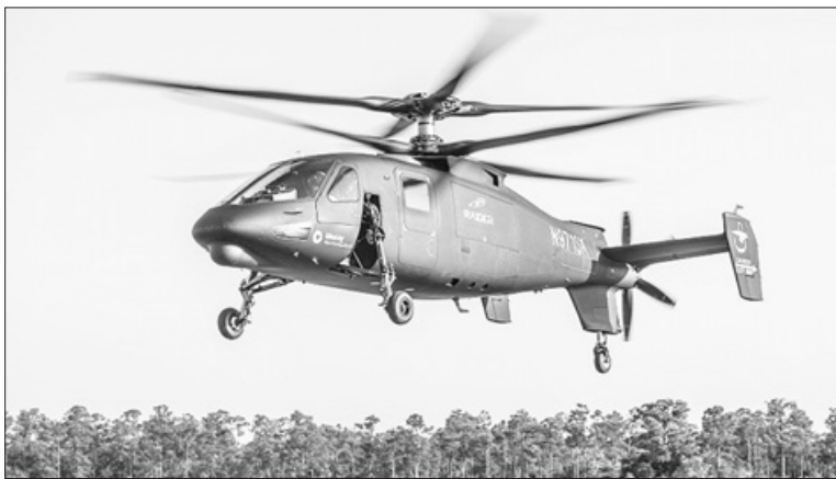
Сторінку підготував Сергій Клименко.

Минулого тижня американська компанія Sikorsky Helicopters вперше підняла в небо свій вертоліт S-97 Raider. Даний вертоліт є штурмовим і надшвидкісним транспортним вертольотом, здатним розвивати максимальну швидкість близько 450 кілометрів на годину завдяки наявності у нього заднього штовхального гвинта. Під час першого польоту, тривалість якого становила одну годину, вертоліт виконав програму з 97 елементів, серед яких – рух по прямій, зависання, розвороти на місці та інші елементи.